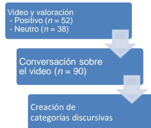
Figura 1. Diseño del estudio.

Se generaron categorías inductivas y a priori en función de cuál era el elemento principal mencionado, el video en que se basaban y la estrategia utilizada para valorarlo. Se compararon las frecuencias de estas categorías mediante la prueba de Chi-Cuadrado.